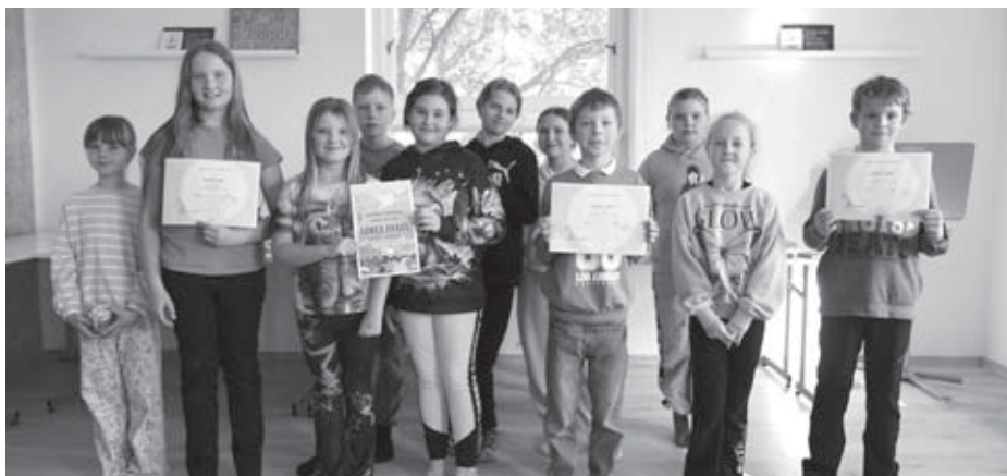
vítězové soutěže Lovci perel 2026

pro tyto věkové skupiny tak rozjede, že asi i padá omítka ze stropu do pracovních počítačů obecního úřadu či Míše a Jindřišce do balíků na poště. Moc děkujeme za